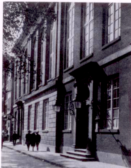
Zo rustig kan het zijn als er niets te doen is (1925)